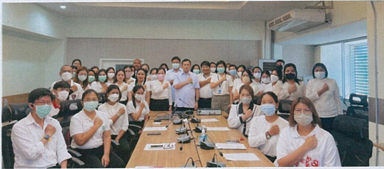
กิจกรรมที่ 5 สนับสนุนกิจกรรมที่เกี่ยวข้องกับการเทิดทูนสถาบันชาติ ศาสนา พระมหากษัตริย์